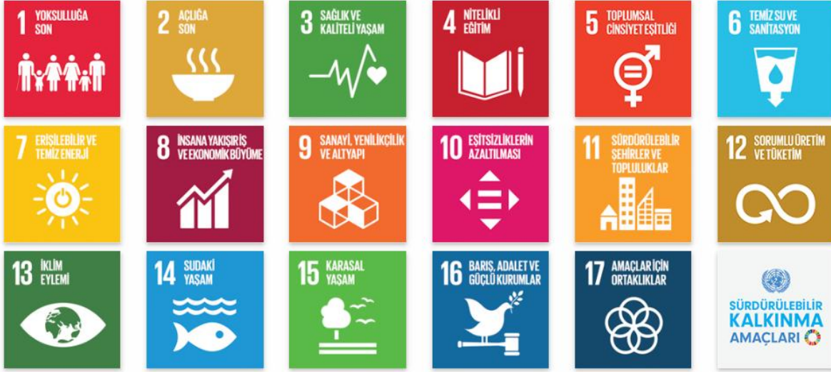
Şekil 2: Birleşmiş Milletler Sürdürülebilir Kalkınma Amaçları

Sürdürülebilir Kalkınma Amaçları, diğer bir deyişle Küresel Amaçlar, yoksulluğu ortadan kaldırmak, gezegenimizi korumak ve tüm insanların barış ve refah içinde yaşamasını sağlamak için evrensel eylem çağrısıdır. 3